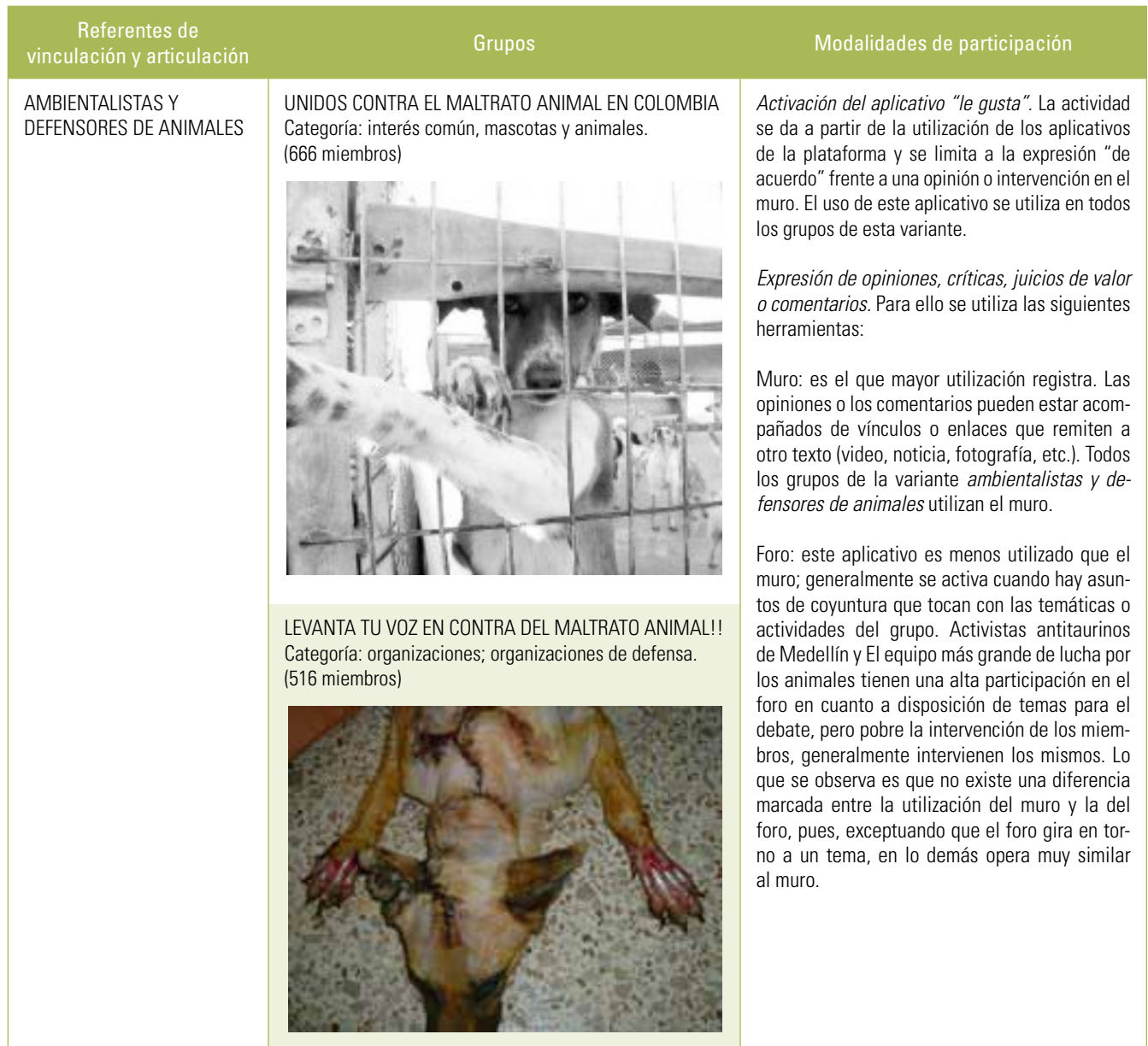
Tabla 1. Modalidades de participación política en los proyectos individuales o de grupos en Facebook.

referentes de vinculación y articulación que constituyen el modo de apropiación escenario de participación social y política (micropolítica) . Estos son: ambientalistas y defensores de animales; reconocimiento a la diversidad (opción sexual y género) . Asimismo, de cada referente de vinculación y articulación se seleccionaron cinco grupos con el propósito de examinar lo que hacen sus miembros a partir de los usos que le dan a las herramientas dispuestas por la plataforma Facebook. La tabla 1 se constituye en matriz de observación y de descripción de las modalidades de participación de los grupos en esta red social, en relación con los referentes de vinculación y de articulación .